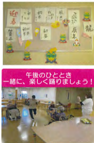
午後のひととき一緒に、楽しく踊りましょう！

クリスマスには、ご入居者様にお菓子とドリンクをプレゼントさせていただきます。ささやかなプレゼントですが、クリスマス気分を味わっていただきました。