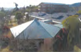
さくら 4階からの初日の出